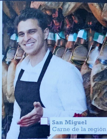
San Miguel Carne de la región