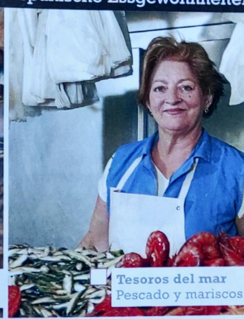
Tesoros del mar Pescado y mariscos