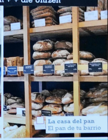
La casa del pan El pan de tu barrio