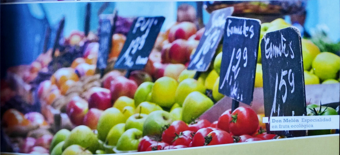
Don Melón Especialidad en fruta ecológica

¿Cómo se llaman estas tiendas? Relacione. Wie heißen diese Geschäfte? Ordnen Sie die Schilder den Fotos zu.