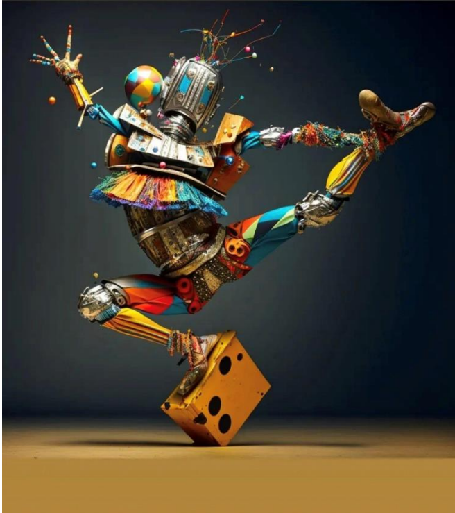
ChatGPT „halluziniert“, Artwork by Midjourney/Aliens_Pulse

ChatGPT „halluziniert“ manchmal, erfindet frei, es produziert bisweilen mathematisch inkorrekte Lösungen und schwächelt ab und an in seiner Logik. Dass heute alle Nutzer-Eingaben und generierten Texte zugleich als Trainingsdaten und zur Weiterentwicklung der KI verwendet werden, führt zu heftiger Kritik bis hin zu generellen Verboten wie etwa in Italien. OpenAI reagierte, heute haben Nutzer die Option, sich dem Trainingsrückfluss zu entziehen. Im schulischen Kontext ermöglichen mittlerweile Anbieter wie SchuleGPT oder die Fobizz-KI einen gesicherten, DSGVO-konformen Zugang zur KI. Und Unternehmen wie das Heidelberger KI-Start-up Aleph Alpha arbeiten an großen infrastrukturellen KI-Lösungen für den europäischen Raum, mit dem Ziel der Unabhängigkeit von US-amerikanischen Cloud-Servern.