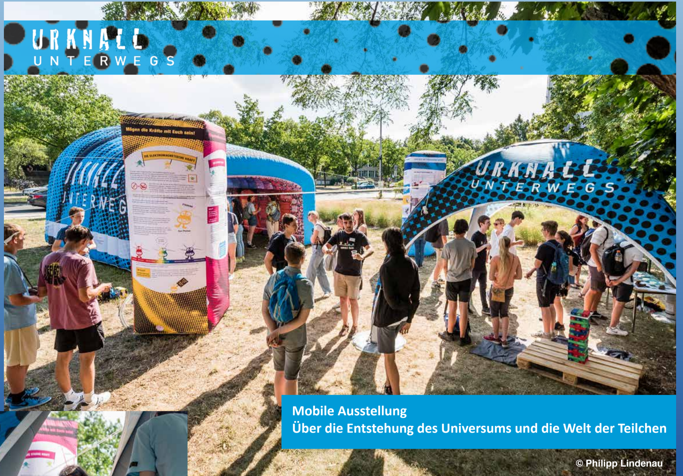
Mobile Ausstellung Über die Entstehung des Universums und die Welt der Teilchen